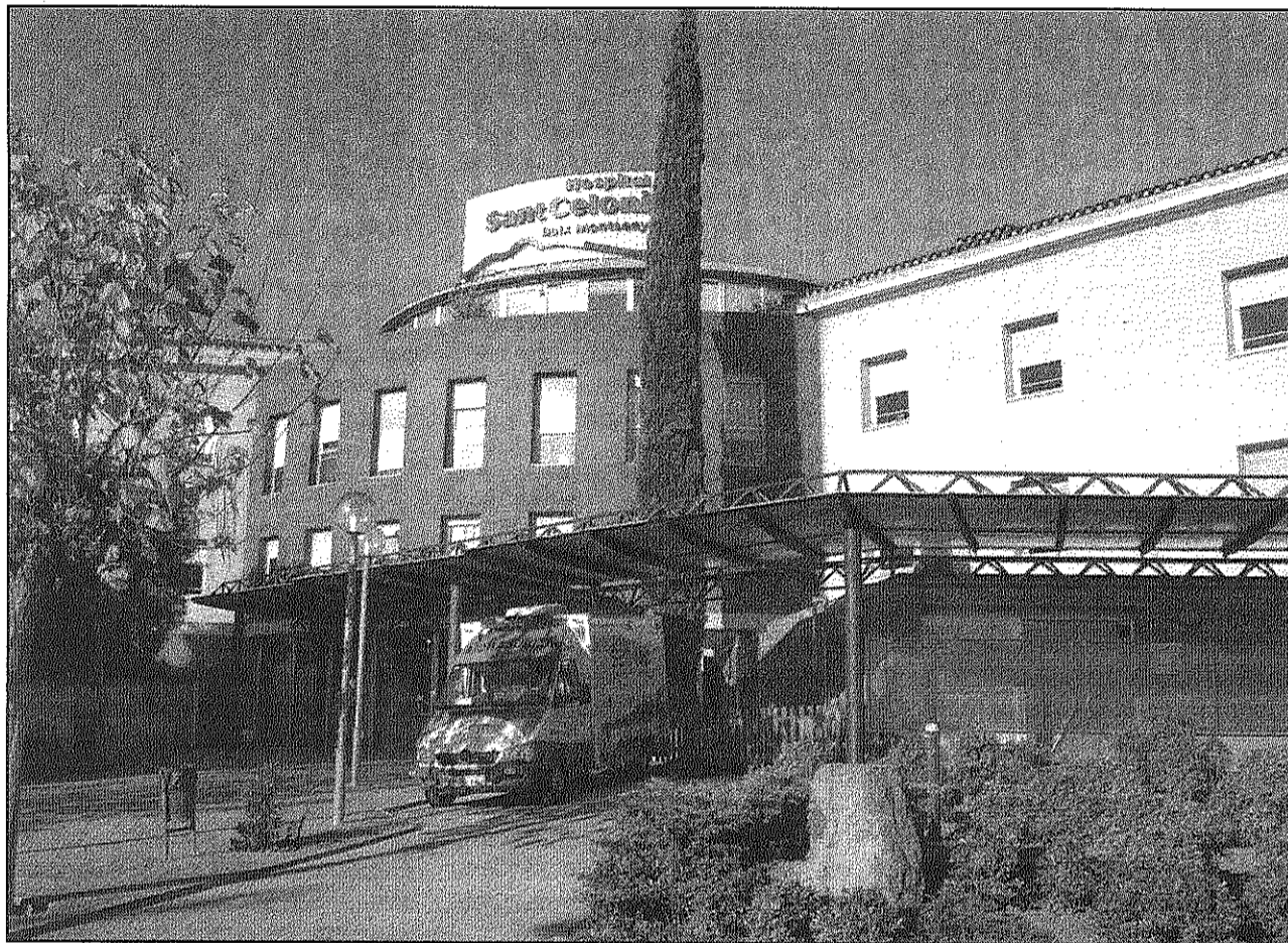
L'Hospital de Sant Celoni ha de deixar d'oferir programes de compra addicional i part de les activitats (AJBM)

En aquest sentit, Gotsens ha recordat que del pressupost de l'Hospital gairebé un 70 per cent corresponen a despeses de personal i ha calgut buscar la rebaixa fixada per la Generalitat a partir del 30 per cent restant. Una disminució pressupostària que s'ha centrat en la reducció del 4 per cent de les activitats que realitzava l'Hospital fins aquest any, la disminució d'un 15 per cent d'alguns programes i el 50 per cent d'altres i l'eliminació dels programes de compra addicional que ofería l'Hospital com els quiròfans de tarda o les consultes externes. El centre sanitari celoni també tancarà una unitat d'hospitalització del juny al setembre "per no contractar personal suplent" durant l'estiu. Una mesura que ja va adoptar en alguns mesos l'any passat i que ampliarà aquest, suposant per a l'Hospital poder disposar d'una quinzena de llits menys, ha explicat Gotsens.