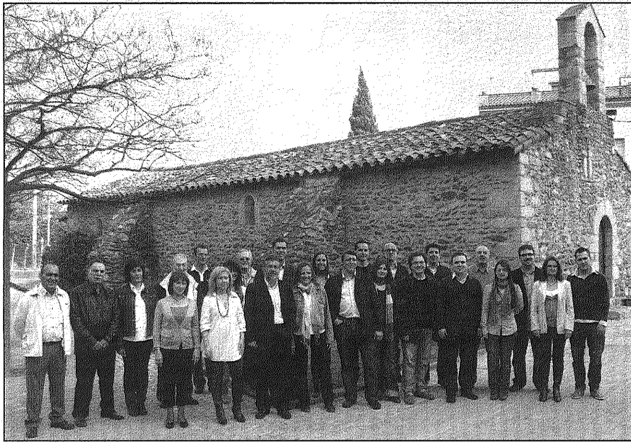
Una imatge dels integrants de la candidatura del PSC de Sant Celoni al costat de l'ermita de Sant Ponç

El candidat assegura que l'equip amb què concorrerà a les eleccions "serà capaç de posar fi a l'actual situació de paràlisi" i el que considera "quatre anys perduts per Sant Celoni". La llista la integren,