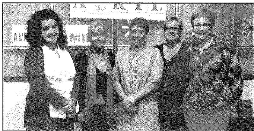
Una imatge de la reunió mantinguda entre ICV i l'ANABM (AdBM)

REDACCIÓ. Sant Celoni Representants d'ICV-EUIA es van reunir dimarts amb la junta de l'Associació Neurològica Amics Baix Montseny per tractar aspectes com les activitats que realitza l'entitat, la feina dels voluntaris, les mancances que detecten i les expectatives de les noves instal·lacions de la seu de l'entitat a la Moncanut on aviat es traslladaran. La formació va presentar alguns dels eixos del seu programa durant la reunió, com no afavorir el creixement urbanístic de la vila, crear noves formes de col·laboració entre indústria i FP, millorar la mobilitat de la C-35 i els polígons industrials, crear un centre cívic, unir els barris de Sant Celoni i la Batllòria amb un carril bici, incorporar