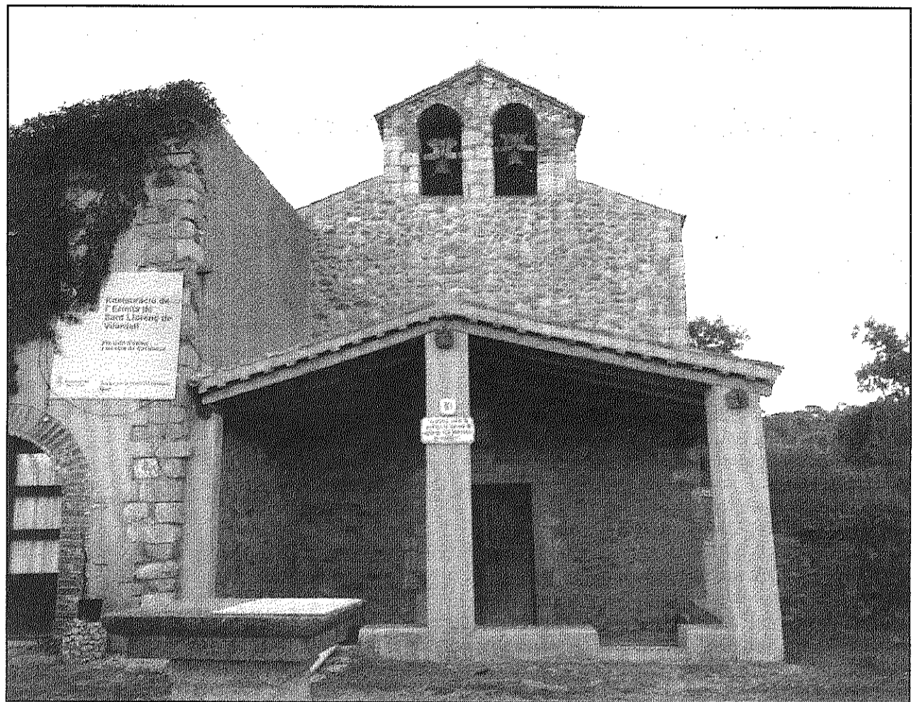
L'estat actual de Sant Llorenç de Vilardell, amb l'entrada recuperada i els murs restaurats (AdBM)