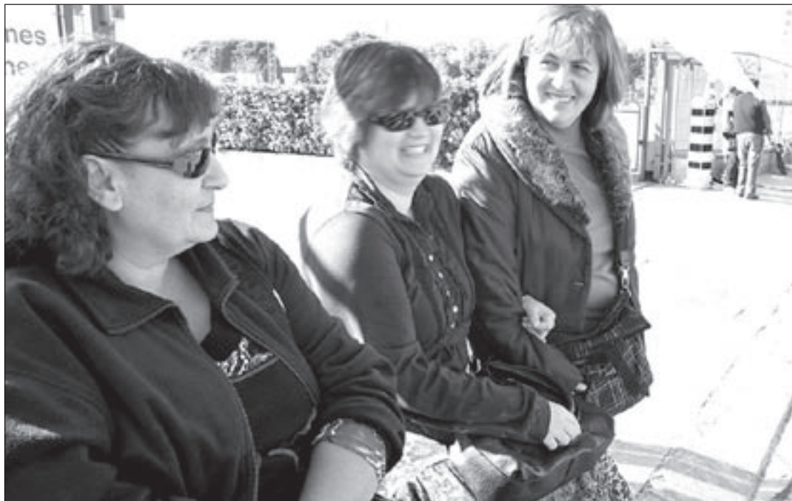
Unes treballadores de Valeo divendres passat a les portes de l'empresa secundant l'aturada