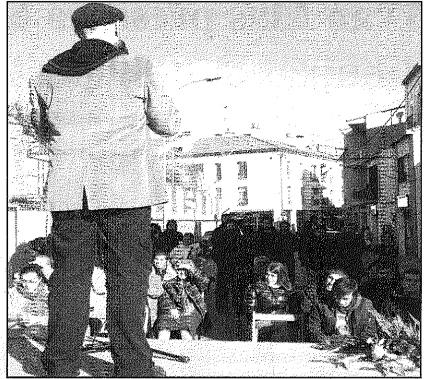
Una imatge de l'acte dedicat al guerriller a Sant Celoni (CPIQS)

Entre els actes programats en el marc del seu 10è aniversari també s'hi compta una xerrada amb Arcadi Oliveres, president de Justícia i Pau, el 26 de febrer, un acte infantil el 9 d'abril, una bicicletada pel territori i una botifarrada popular el 14 de maig i l'exposició del 10è aniversari 'El millor homenatge: la victòria!' del 9 al 24 de juliol.