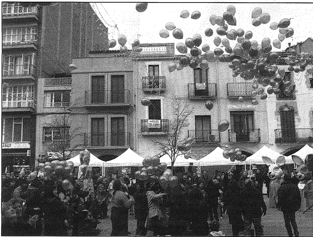
L'enlairament de globus va ser un dels actes més emotius dels programats en motiu de la Marató (AdBM)

Per la seva banda, la Penya Barcelonista Vilamajor's va recaptar un total de 920 euros durant el partit entre el RCD Espanyol i el FC Barcelona que s'han donat íntegrament a la Marató. La recaptació va