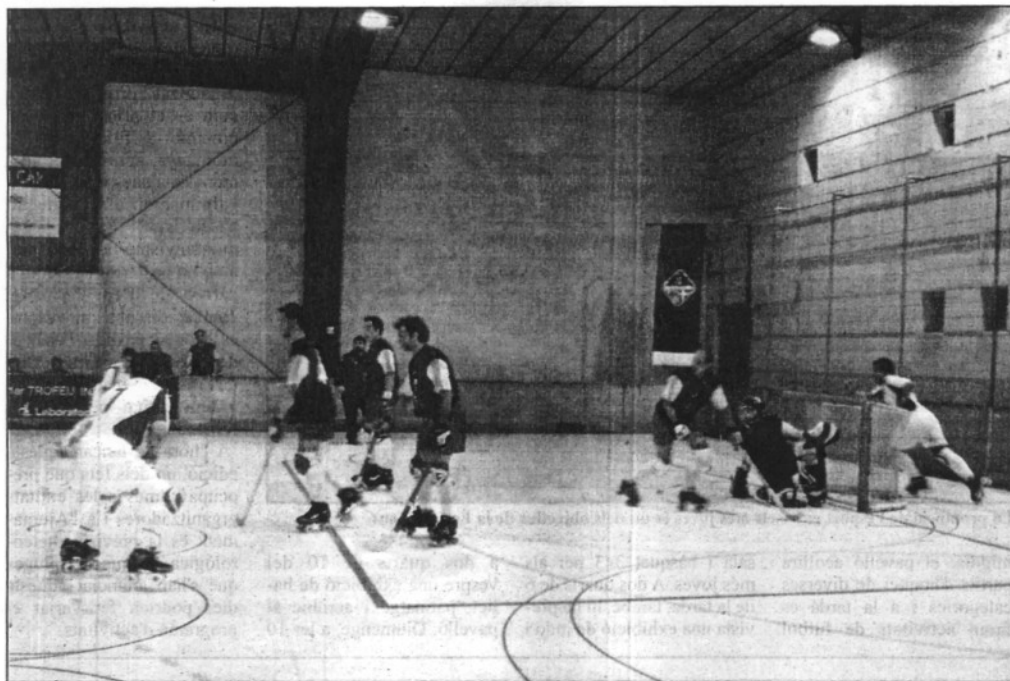
Una imatge del partit disputat dimecres al vespre a la pista de Sant Celoni

Els jugadors celonins van contenir els xilens en un partit obert i amb opcions alternes