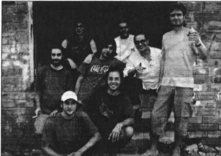
Una imatge conjunta de Los Manolos i del grup de la Garriga Gertrudis (L'ABRM)

L'espectacle que es podrà veure a l'Ateneu té el seu origen al festival Acústica de Figueres on, per primera vegada, Los Manolos i Gertrudis van actuar conjuntament en directe. L'èxit d'aquell esdeveniment i la bona relació entre ambdós conjunts va fer que es