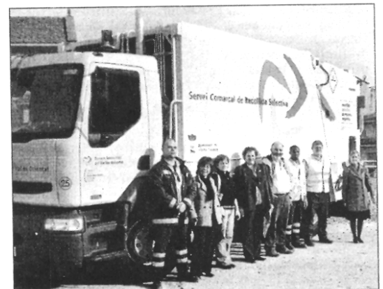
El nou camió que farà la recollida es va presentar dimecres

servei pel que feia a reposició dels contenidors trencats i de la freqüència de pas, va fer decidir l'Ajuntament a rescindir el contracte. Ara el consistori espera que el servei de recollida de brossa millori. Aquest servei s'emporta bona part del pressupost de les despeses de béns corrents que el consistori fa cada any en el seu pressupost.