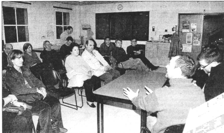
El nou telecentre de Sant Celoni es va inaugurar divendres passat a la Rentadora