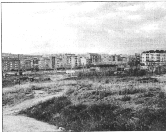
La zona de la Bòbila està situada entre el carrer Josep Umbert i la ronda Sud

Segons l'Incasol, el model es basa en l'articulació del territori i de la ciutat mitjançant una xarxa verda de grans espais arbrats amb vegetació al llarg de totes les infraestructures viàries. L'elevat desnivell de tot aquest sector també condicionarà la distribució dels