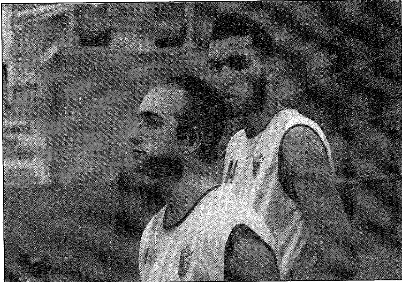
Els jugadors del Llinars no van poder aguantar els parcials positius i van perdre al darrer quart a l'Escala (AdBM)

Tampoc va poder començar l'any amb victòria el CB Arbúcies al grup primer de Tercera catalana i va tancar la seva visita a la pista del Bisbal Bàsquet amb un marcador advers de 79-69, que a més el relega a la quarta posició de la classificació. L'equip arbucienc intentarà ara corregir aquesta situació en el partit que jugarà dissabte,