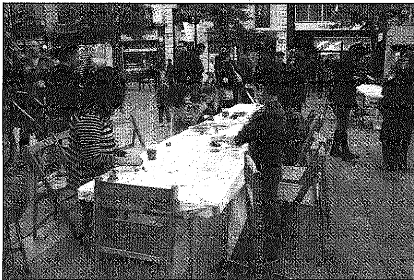
Una imatge dels actes organitzats per Bocs i Cabres dissabte

REDACCIÓ. Sant Celoni L'entitat Bocs i Cabres de Sant Celoni va organitzar dissabte la festa de la Castacabrançada a la plaça de la Vila. Al llarg de la tarda de dissabte van aconseguir omplir la plaça de la Vila de nens i famílies