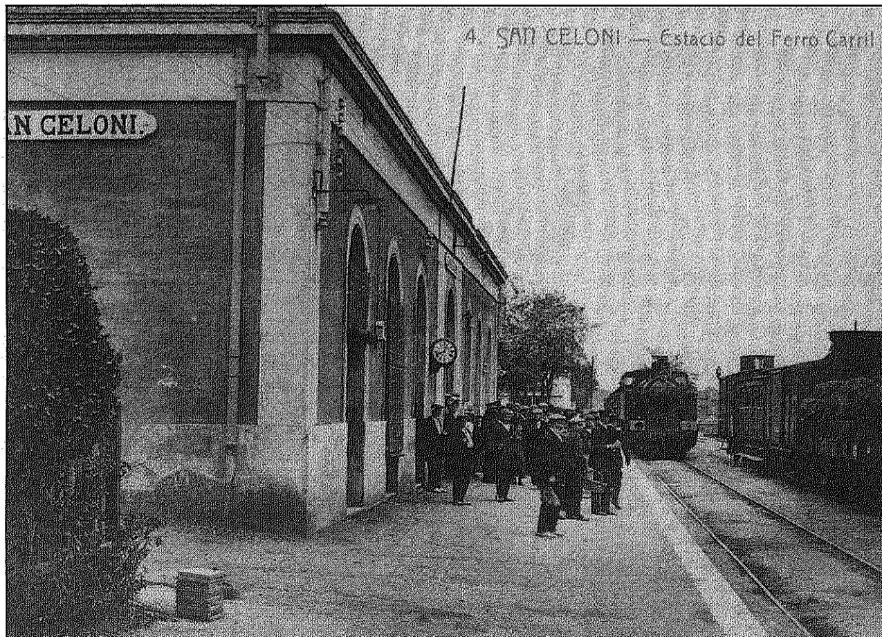
Una de les imatges que es podran veure a l'exposició sobre els 150 anys de l'arribada del ferrocarril (AdBM)

Els actes de la capvuitada també inclouen un concert de música tradicional amb Folkincats, dissabte a les 10 del vespre a la sala petita de l'Ateneu, i amb l'exposició de Motos Històriques diumenge al matí a la plaça de la Vila. Una mostra, aquesta darrera, que es complementarà amb un passeig amb els diversos models participants pels carrers del centre de la Vila a mig matí.