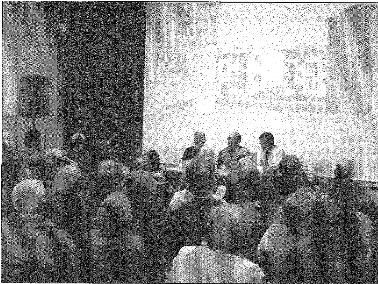
Una imatge de la presentació del recull fotogràfic i històric 'L'Abans' a l'Ateneu de Sant Celoni