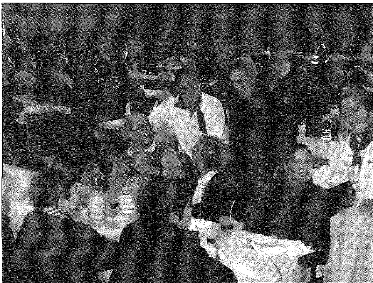
El nou pavelló del Sot de les Granotes va aplegar uns 250 voluntaris i usuaris de la Creu Roja (A&BM)

Quietet també va destacar "l'aliança estratègica" que s'ha anat forjant al llarg d'aquests anys amb altres entitats i institucions, com l'Associació Neurològica Amics Baix Montseny, Càritas, els Serveis Socials de l'Ajuntament i el mateix Consistori. Precisament avui, divendres, i demà dissabte, Càritas i Creu Roja impulsen el recapte del Banc d'aliments amb els que els veïns del municipi podran aportar llet, llegums crues, oli o conserves de peix a les seues socials de Creu Roja o de Càritas de 9 del