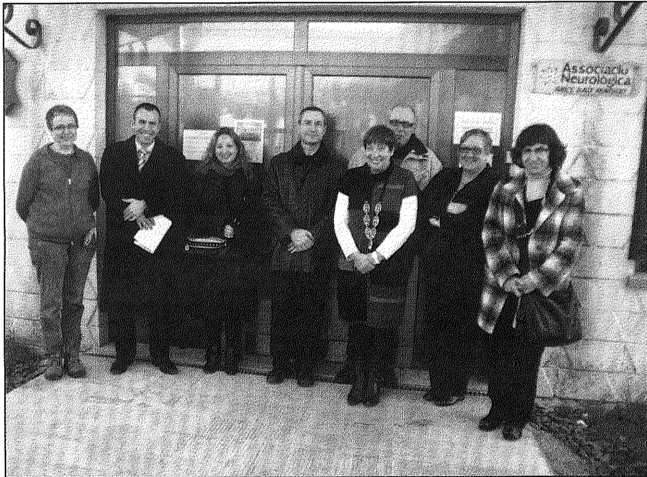
Representants de l'ANABM, la Fundació Adecco i Cray Valley dimecres a la seu de l'Associació (AdBM)