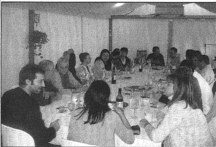
Els empresaris van visitar Arbúcies, el celler de Sant Feliu i Breda (AdBM)

Els contractes, per un termini de sis mesos, s'han fet a través dels ajuntaments a persones en situació d'atur inscrites com a demandants d'ocupació a les oficines de treball, que no cobraven la prestació o subsidi d'atur o els mancava un mes per exhaurir-la. Les persones contractades tenen l'obligació de formar-se, fora de la seva jornada laboral, amb una durada mínima de 60 hores i un màxim de 125 hores d'acord amb les característiques del pla formatiu. Els contractats han treballat en projectes vinculats a les energies renovables i estalvi i eficiència energètica; rehabilitació d'habitatges i edificis públics; i tecnologies de la informació i la comunicació.