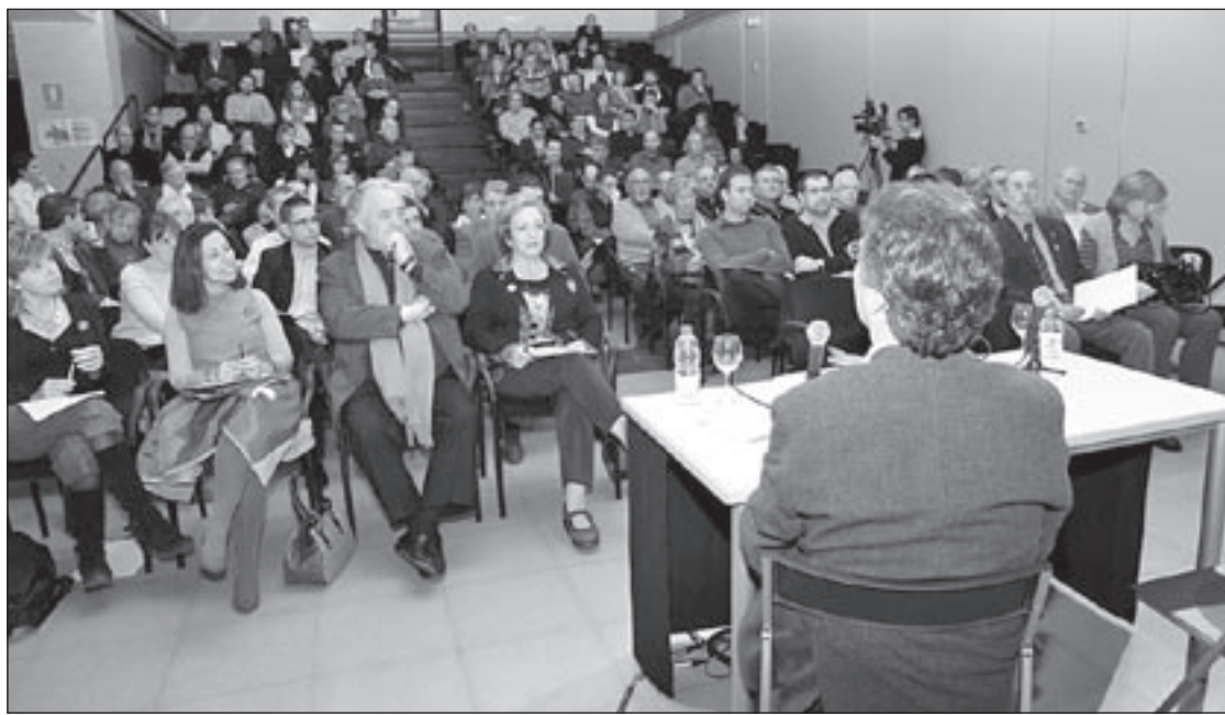
La jornada es va fer aquest dissabte al matí a la sala petita de l'Ateneu de Sant Celoni, que es va omplir de públic

Aquests detalls es van donar a conèixer aquest dissabte en la jornada Futur Desenvolupament del Baix Montseny, que es va fer a