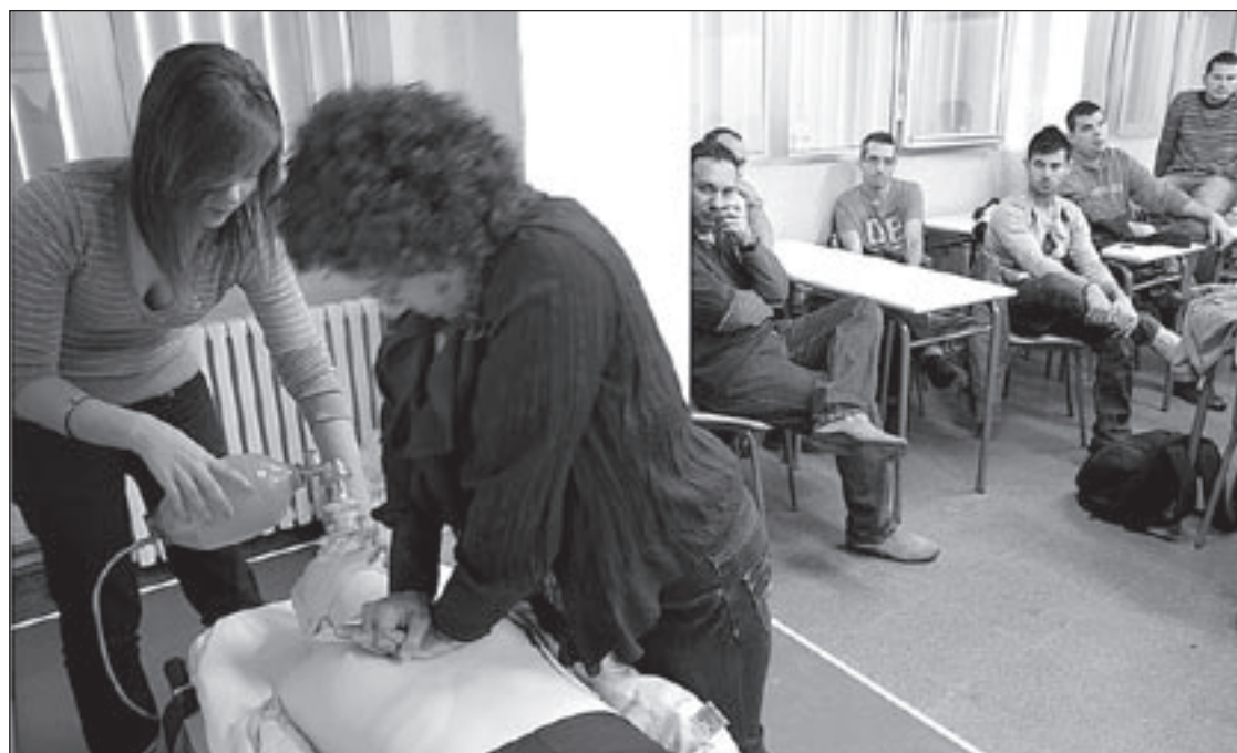
Alumnes del cicle durant una classe pràctica aquest dimecres a la tarda a l'EMT

L'Ajuntament de Mollet i l'Associació Pro-Memòria als Immolats per la Llibertat a Catalunya organitzen aquest divendres l'homenatge al president Lluís Companys al monument del parc que porta el seu nom. L'acte, que es fa cada any en homenatge a les persones que van morir per defensar la democràcia, es farà a les 6 de la tarda amb una ofrena floral.