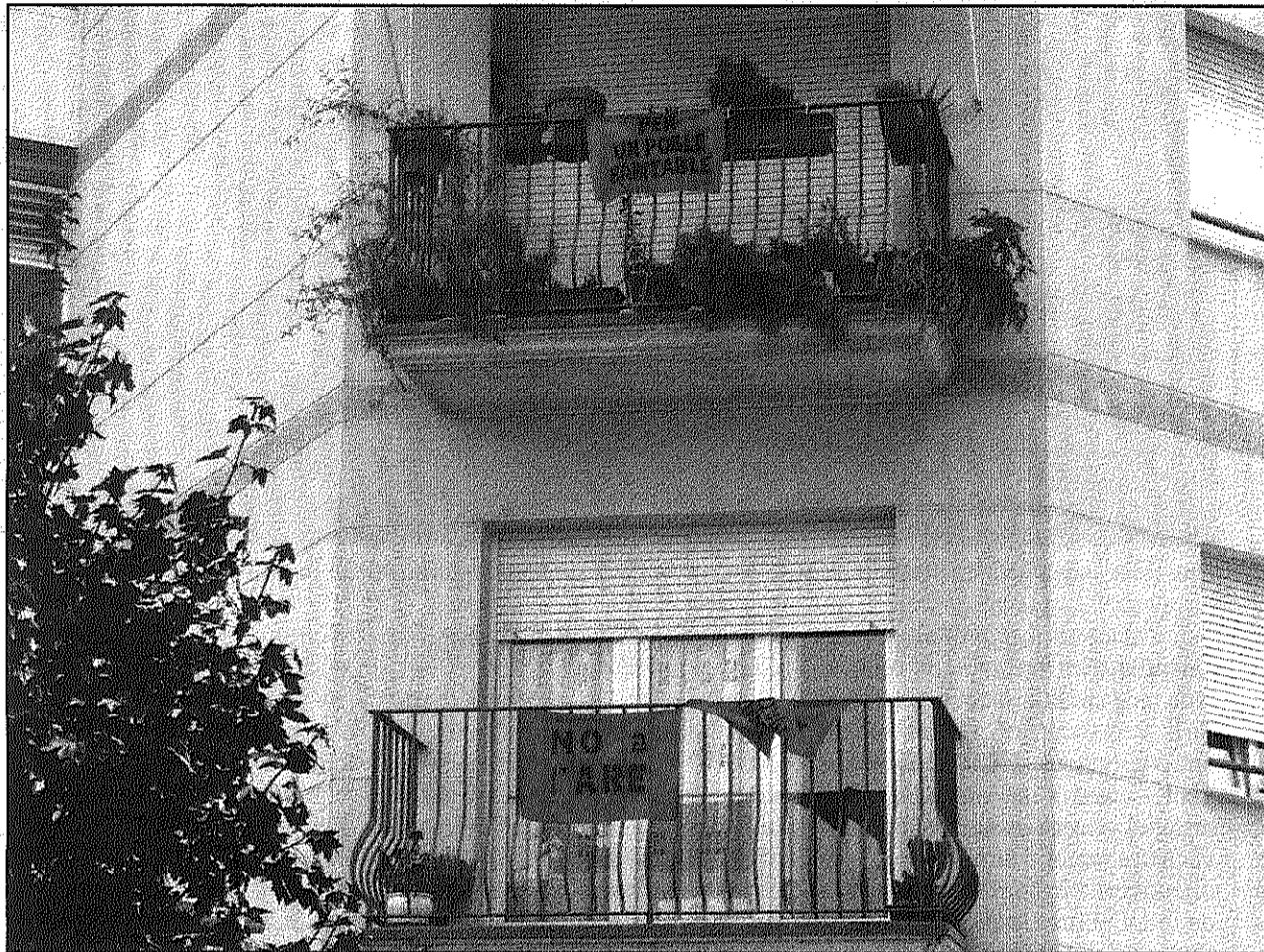
El rebuig dels veïns a l'ARE es va manifestar a la consulta popular amb un 70 per cent de vots en contra (A&BM)

L'ARE de Sant Celoni, previst inicialment a Can Riera de l'Aigua,