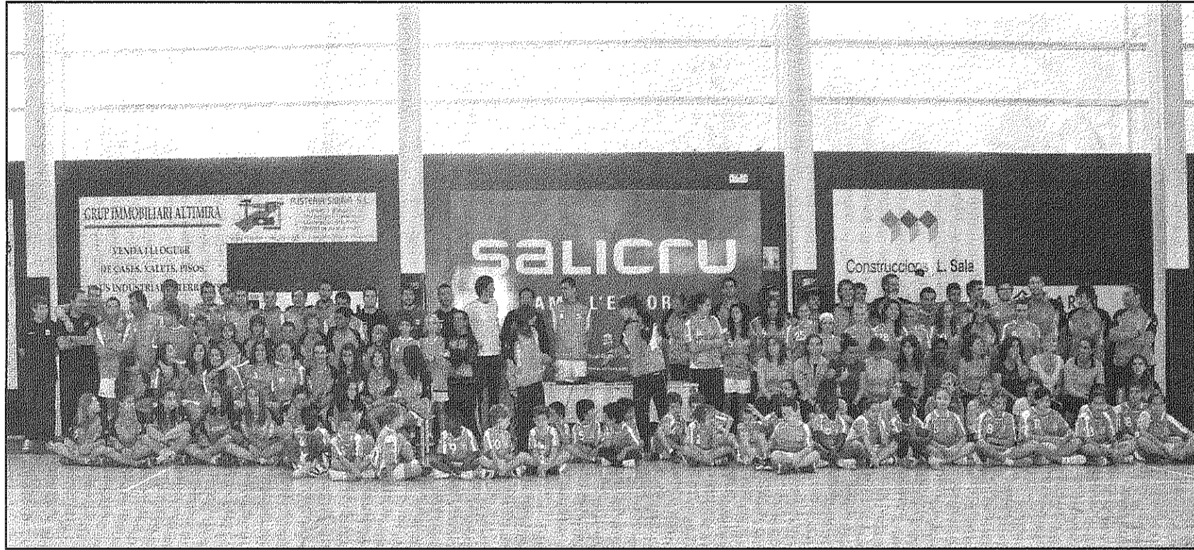
L'Handbol Palautordera va presentar aquest cap de setmana els equips del club de la temporada (NEUS JULIÀ)

■ L'Handbol Palautordera Salicru s'imposa al BM Zaragoza 37-34 el dia de la presentació dels equips del club