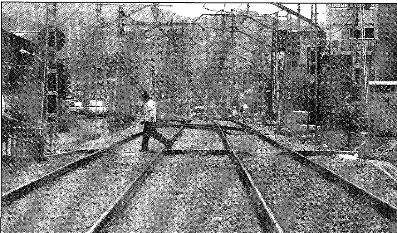
Els usuaris travessen la via de Sant Celoni a nivell, sobretot els caps de setmana

REDACCIÓ. Sant Celoni Després de l'accident ferroviari que va produir la mort de 13 persones i més d'una vintena de ferits per la revetlla de Sant Joan quan