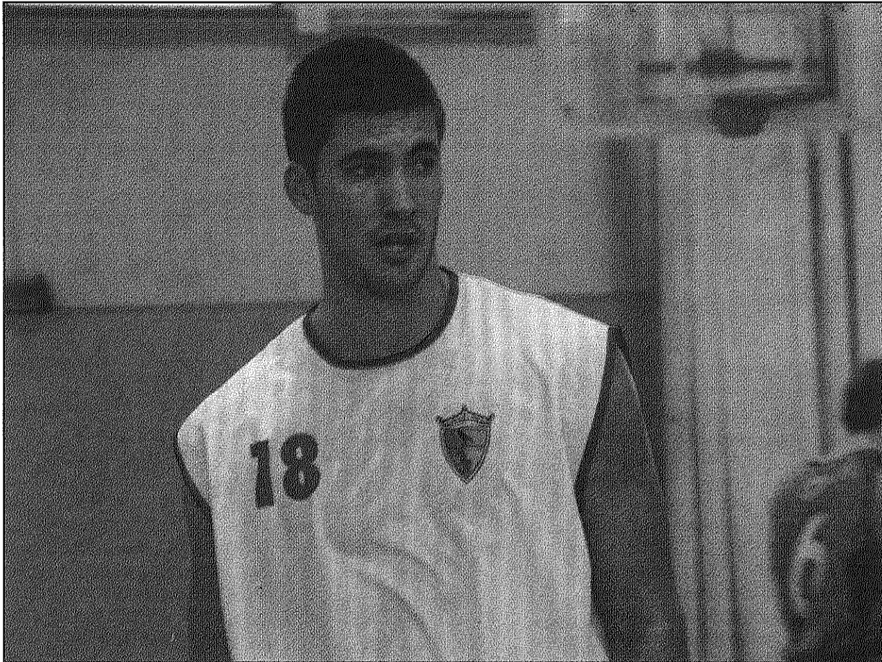
El CB Llinars ha pogut trencar amb la ratxa de derrotes amb la que ha començat la temporada

Al grup setè de Tercera catalana, el CB Sant Celoni segueix amb la sequera de resultats i el cap de setmana passat va sumar la cinquena derrota. Tot i això, no li va posar gens fàcil la victòria al líder, el CB Mollet, que es va emportar el triomf amb un ajustat 63-65. Diumenge, a dos quarts de 6 de la tarda, els celonins juguen a la pista