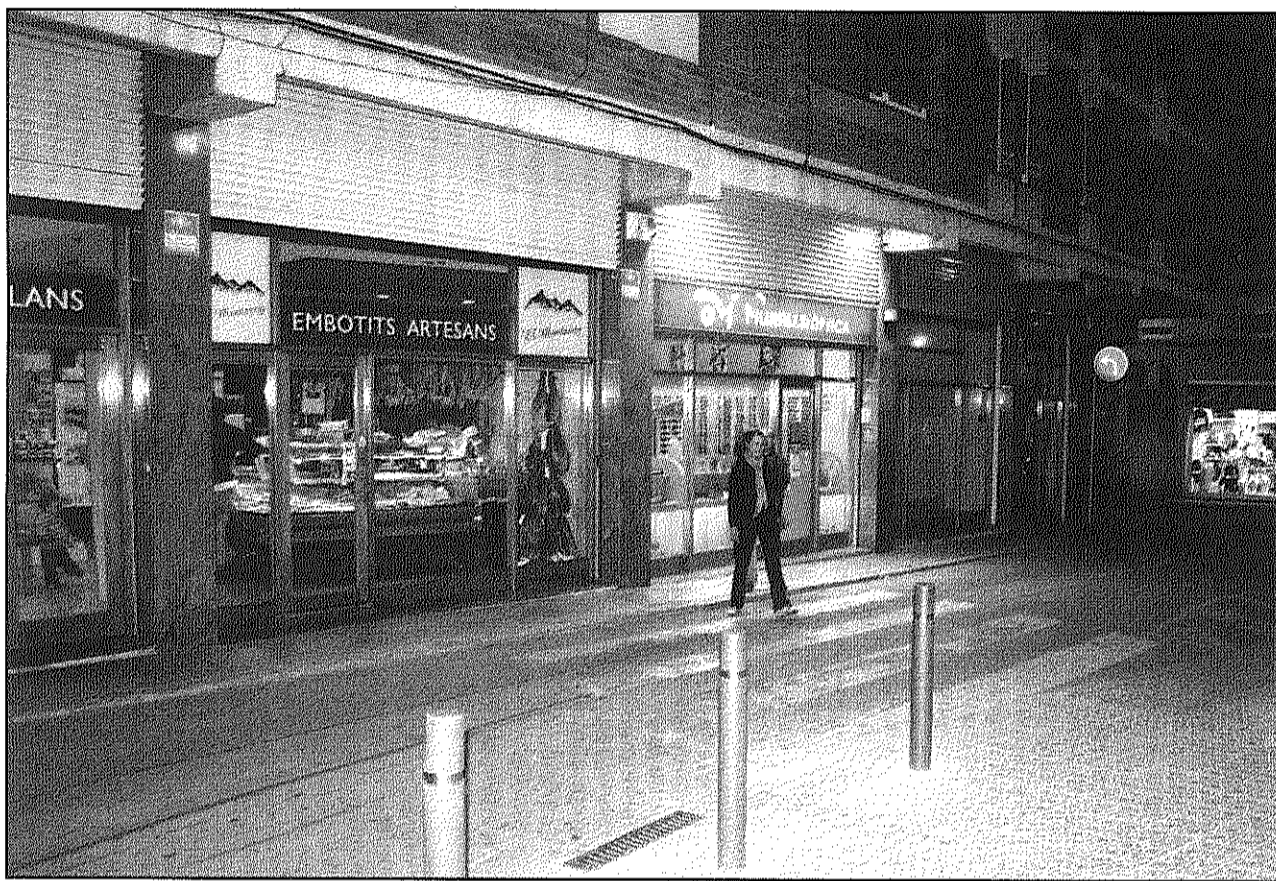
Una imatge del carrer Abat Oliba on en els propers dies començaran les obres de millora del paviment

Per alleujar el problema de cara a la campanya comercial nadalenca, l'Ajuntament aturarà les obres des del 20 de desembre fins passat Reis, a petició expressa dels comerciants. La mesura provisional