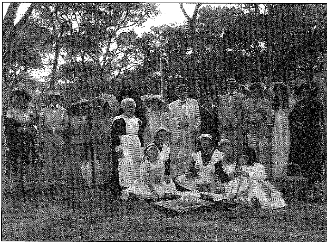
Artistes amateurs de Cardedeu dinamitzaran les visites escenificant escenes del passat de la vila (Aj. de Cardedeu)

Arbúcies/Sant Feliu de Buixalieu. Diumenge s'organitzen visites guiades gratuïtes al Castell de amb inscripció prèvia al telèfon 972 860 908 o a través del correu electrònic memgarecepcio@ajarbucies.cat. El castell de Montsoriu està situat en un turó de 640 m del Parc Natural del Montseny i és propietat del Consell Comarcal de la Selva. Des de l'any 1993 el Museu Etnològic del Montseny hi dirigeix intervencions arqueològiques del que és, potser, el millor