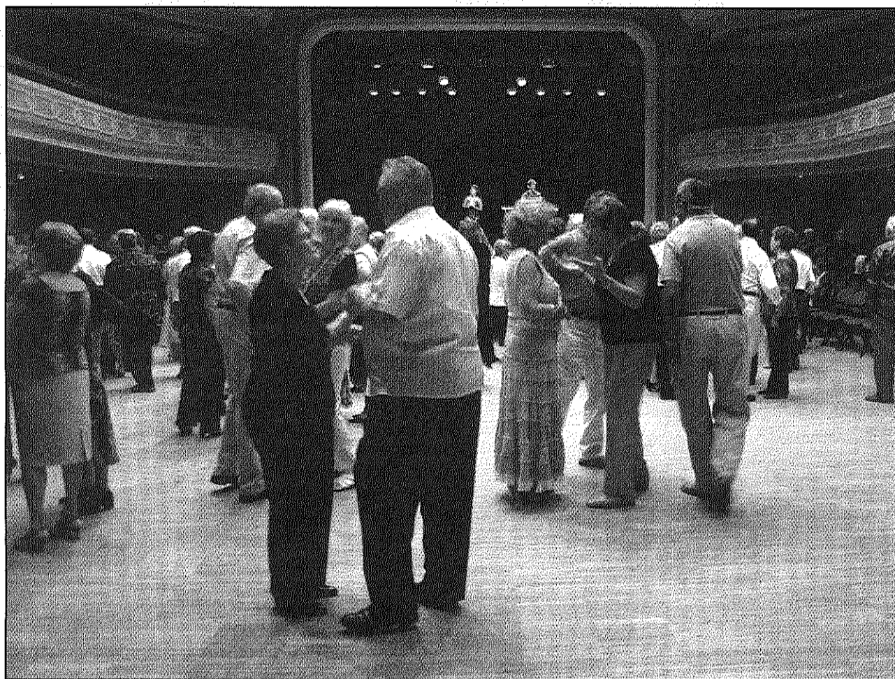
La jornada va cloure amb un ball amenitzat per l'orquestra Moncayo, amb més de 300 participants