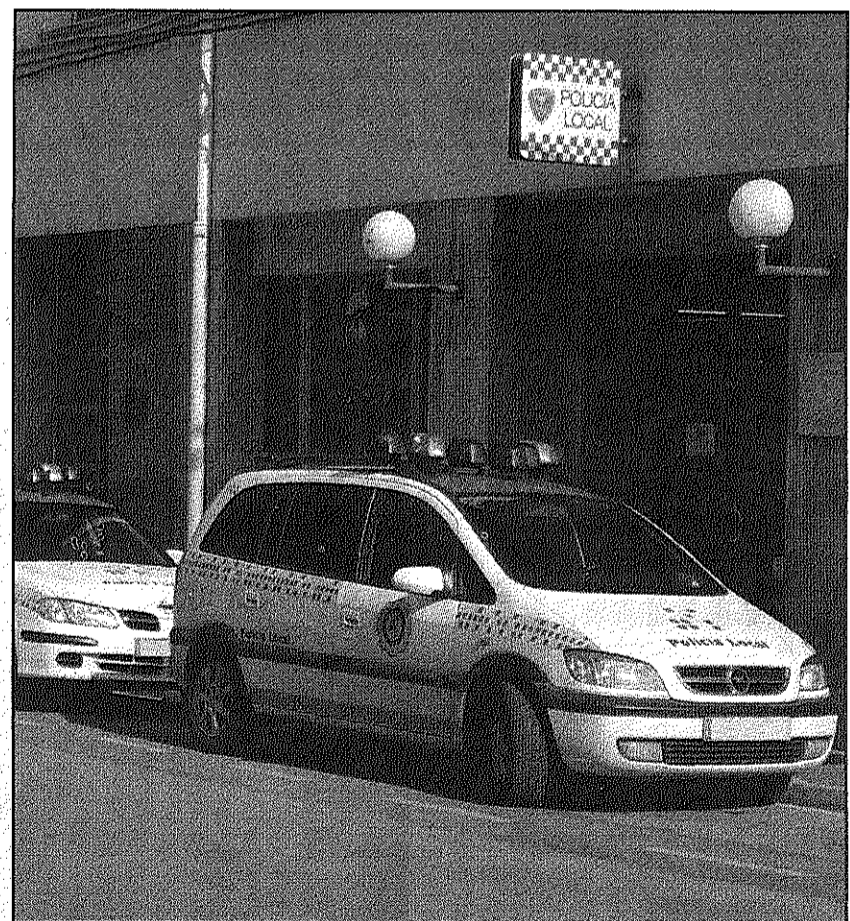
La Policia Local celebrava anteriorment els Sants Custodis (AdBM)

A la missiva Bueno remarca el paper de la Policia Local com a garant de la seguretat, la llibertat i el progrés perquè "tothom pugui exercitar els seus drets de manera igualitària" i com a "peça clau pel desenvolupament de les nostres llibertats".