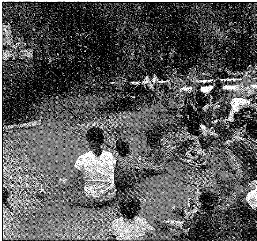
Els més petits van poder gaudir l'any passat d'una sessió de titelles (AdBM)

Com a ressopó, els organitzadors proposen el monòleg 'En marxa atrás' de l'actor Joan Cros abans de procedir al ball de nit amb el grup La portàtil FM a les 11 de la nit.