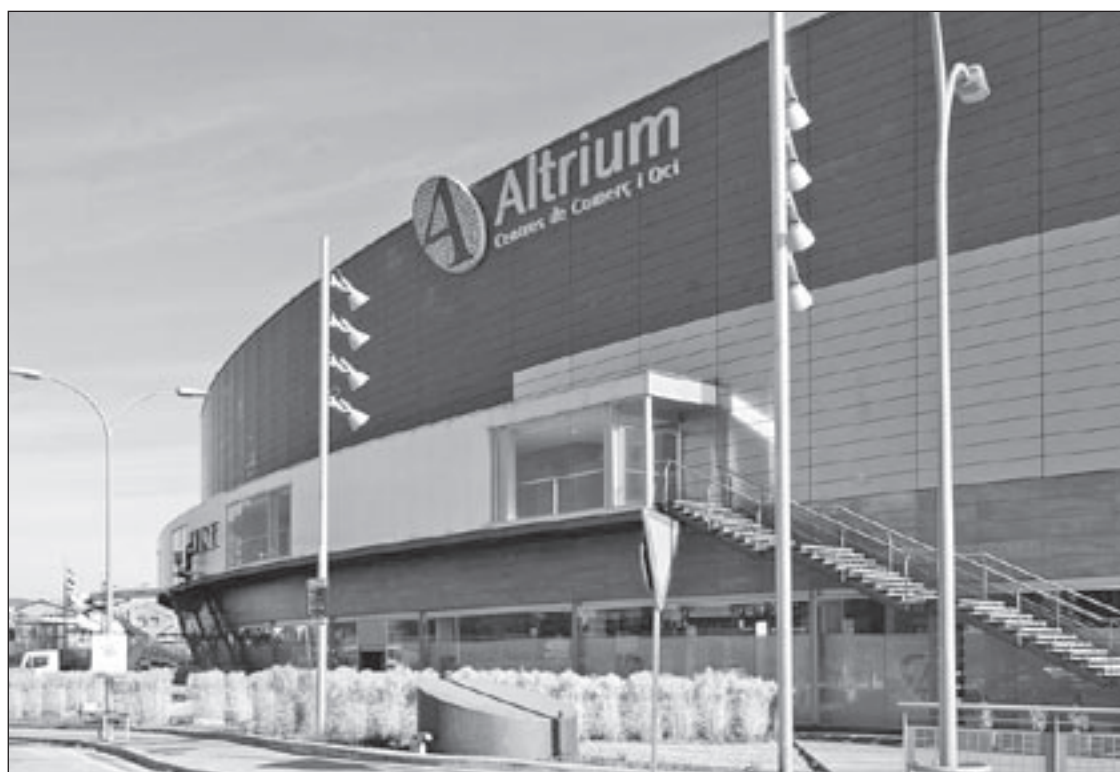
El centre comercial Atrium no compleix la normativa urbanística del municipi

"L'empresa va demanar el fraccionament del deute perquè es troba en una situació complicada i nosaltres els hi