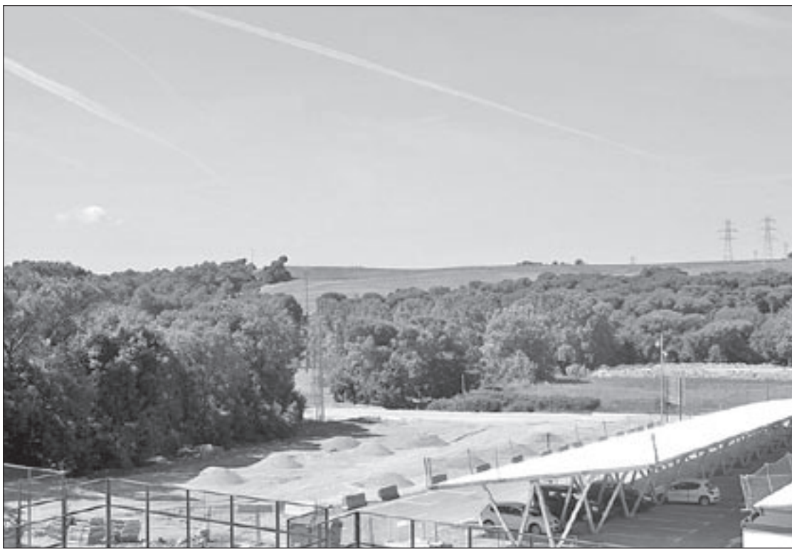
La requalificació afecta una zona compresa entre el complex esportiu i els terrenys del futur circuit de karts

L'àmbit de Breinco té una superfície de 43.862 metres quadrats i és ocupat per les edificacions de l'empresa de materials de construcció Breinco. El pla general les qualificava fins ara com a sòl no urbanitzable. Can Culebras és un sòl agrícola que ocupa una