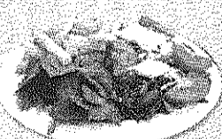
Plato de Kebab