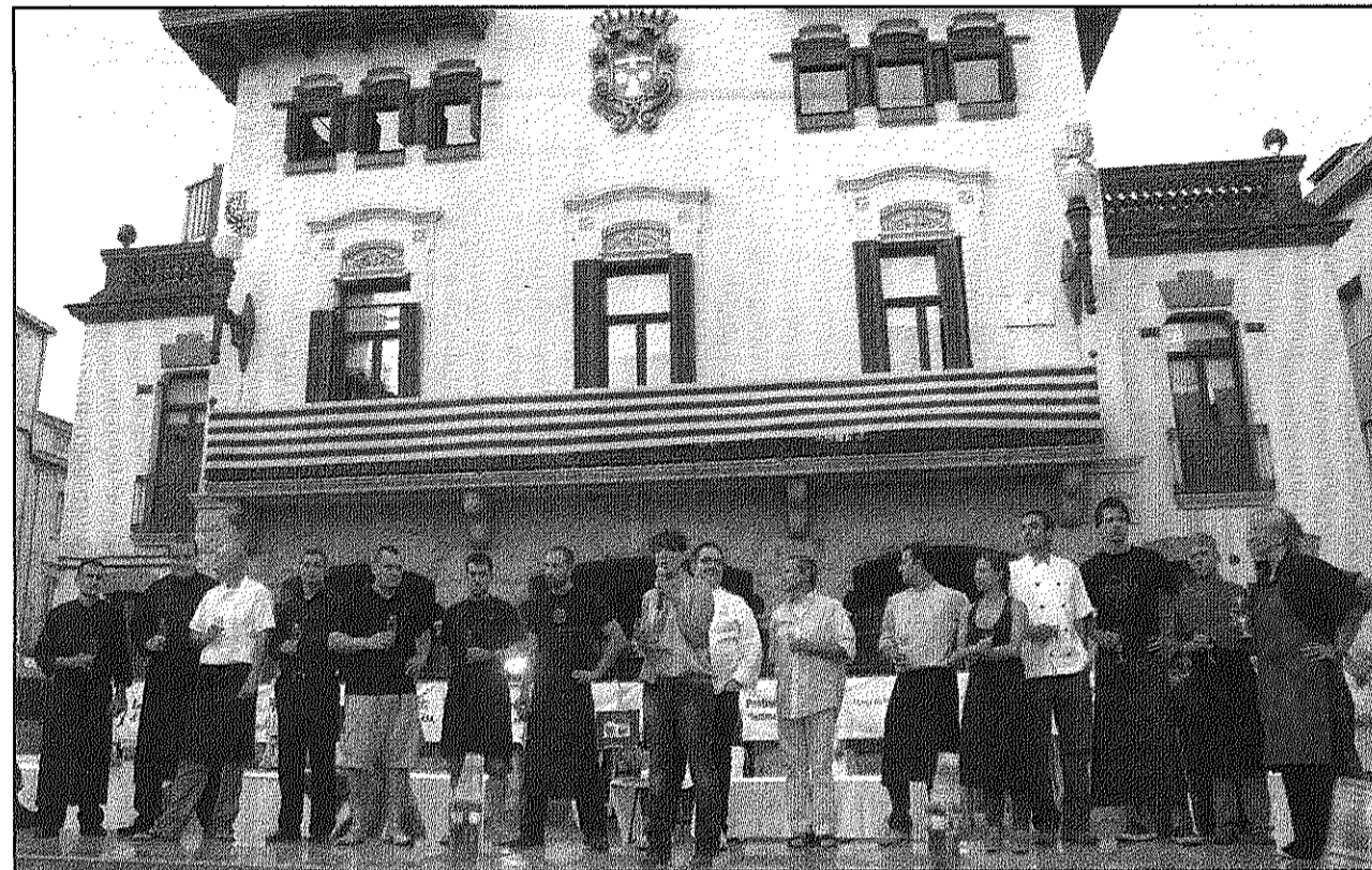
Una imatge dels restauradors, pastissers i titulars d'establiments participants als Tastets

La valoració dels Tastets d'estiu ha estat positiva, ja que, s'han venut un total de 585 tiquets. Cinc-centes vuitanta-cinc persones que om-