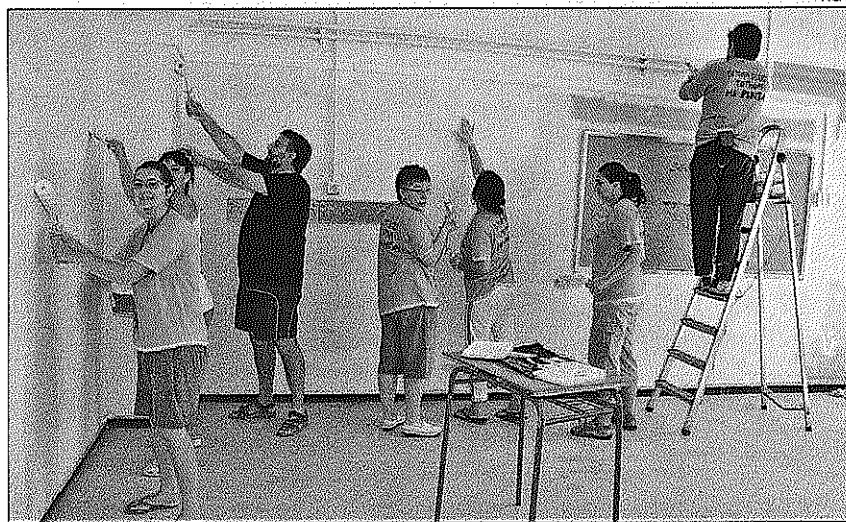
Padres y profesores se pusieron manos a la obra para mejorar el IES.

Desde el curso 2008-2009 el Ampa del IES Baix Montseny colgó una pancarta, que todavía hoy se puede leer, demandando un instituto digno "porque hoy todos los miembros de la comunidad tenemos el convencimiento de que el centro lo hacemos las personas y todos compartimos el