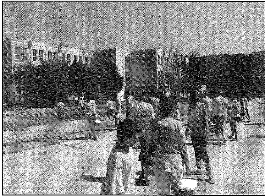
Una imatge de la primera sessió per pintar el centre educatiu (AdBM)

Unes 80 persones van participar a la primera sessió per pintar l'interior de l'edifici