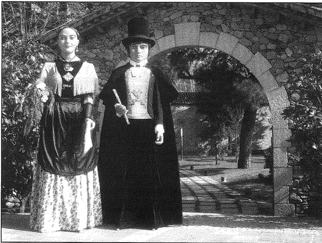
La colla farà el recorregut portant els gegants locals Martí i Maria del Puig fins a la capital gallega (A4BM)

El 7 d'agost es faran 33 quilòmetres per arribar a Pedrouzo en un