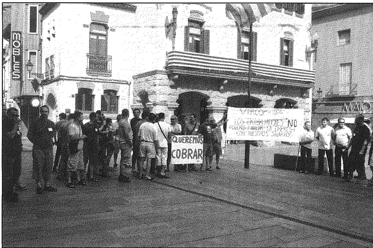
Una imatge de la concentració de treballadors de Vircop dimecres a la plaça de la Vila de Sant Celoni (Mireia Ruiz)

A finals de maig, en una reunió amb inspecció de treball, els treballadors de Coperfil Group, Technoclad i Vircop Steel Components van arribar a un acord de calendari pel pagament de les nòmines endarrerides que en aquell moment acumulaven tres mesos. Un calendari que preveia els cobraments per abans de mitjans de juliol. Ara, explica Làzaro, amb l'incompliment dels acords, la situació s'ha complicat per a molts treballadors, especialment de Coperfil, que no haurien cobrat des del mes d'abril i que tenen en marxa un Expedient de Regulació d'Ocupació extintiu. Segons el representant del Comitè d'Empresa, després de l'acte de