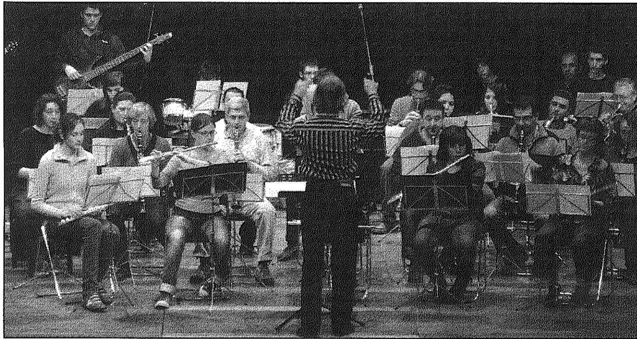
Els alumnes de l'Escola Municipal de Música actuaran dijous a la plaça de la Biblioteca (A&BM)

REDACCIÓ. Sant Celoni El proper dijous, 8 de juliol, a les 10 del vespre, se celebra a la plaça