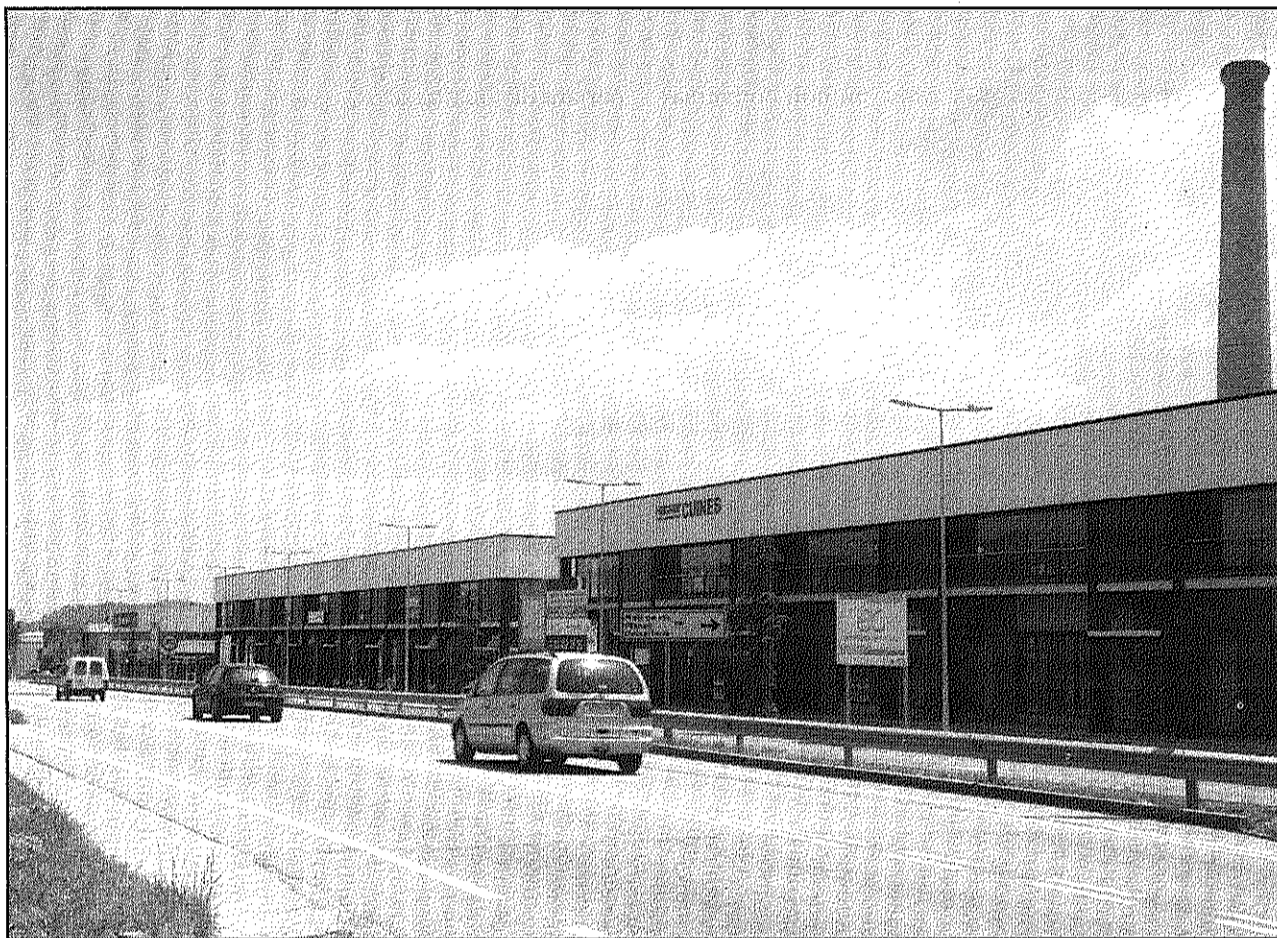
Govern i oposició divergeixen sobre si s'ha de permetre establir comerços de proximitat al polígon (A4BM)

El PSC, per la seva banda, va remarcar que les zones del polígon incloses no compleixen amb el que estableix el Decret Llei del Departament d'Innovació, Universitats i Empresa, que demana que, per ser considerada Trama Urbana Consolidada siguin espais de continuïtat de la trama urbana, siguin compactes, permeables en quant a accessibilitat i disposin d'una concentració urbana determinada.