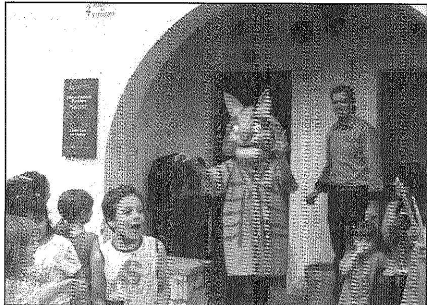
Imatge de la presentació del capgròs de l'escola, el Tigretó

REDACCIÓ. La Batllòria Fins a 10 colles geganteres van participar dissabte a l'acte central de commemoració dels 20 anys dels Gegants de la Batllòria que va haver de començar amb mitja hora de retard a causa de la pluja. Com a inici de la festa, els alumnes del CEIP Montnegre van fer el bateig d'un capgròs elaborat pels nens i nenes de l'escola, el Tigretó. Posteriorment, prop d'una trentena de gegants van oferir una cercavila pels carrers de la població. Entre