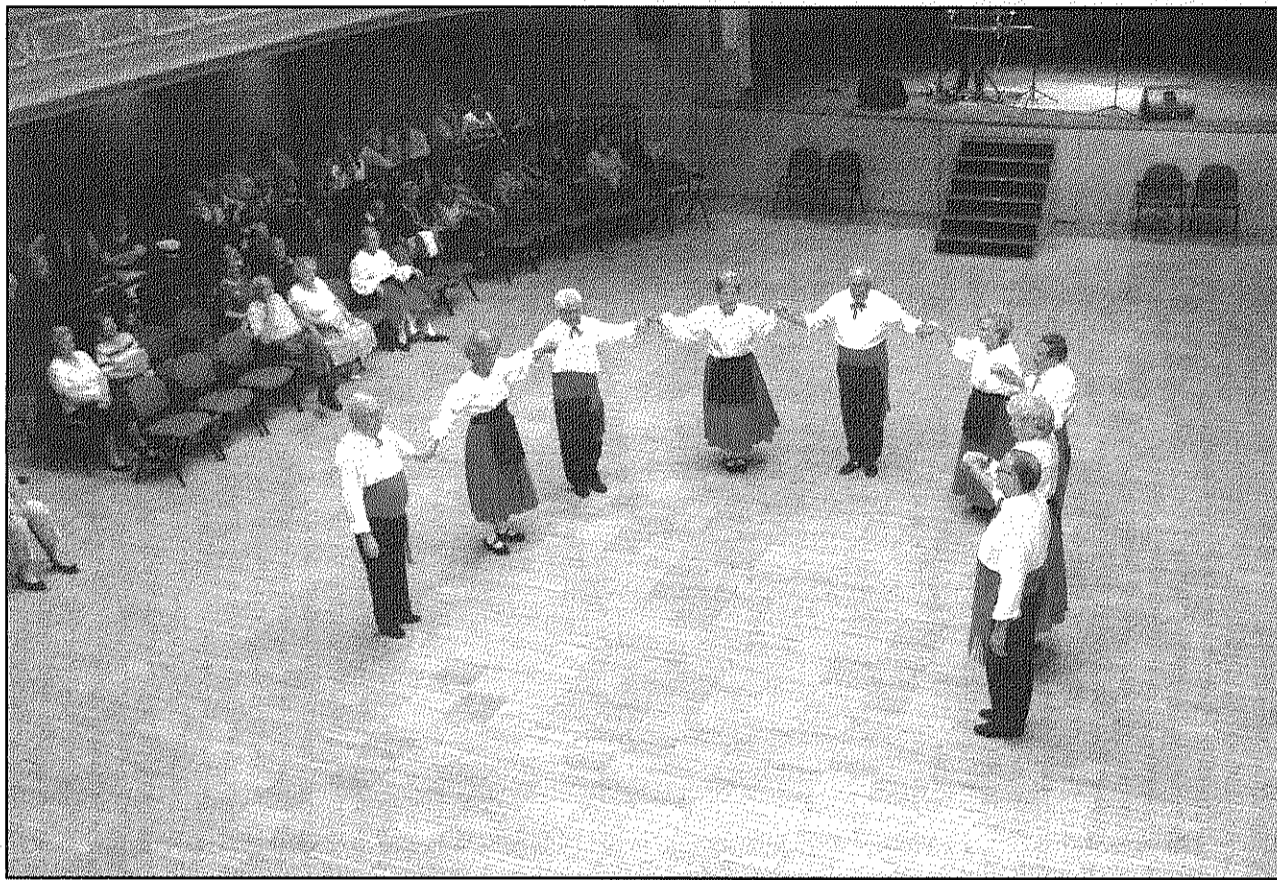
Imatge d'una de les actuacions de l'esbart l'any passat durant la mostra d'activitats de l'Esplai

L'esbart dansaire és un grup format per sis parelles que faran tres balls al ritme de La Bolangera – dansa d'origen francès- del Ball Pla d'Alinyà, que és un ball tradicional i conegut arreu de Catalunya que es balla per parelles i que es pot definir com a ball de gala i de tall noble. La seva música marca dos temes diferenciats: el primer o de passeig i un segon que és el ball pròpiament dit; i finalment, d'una dansa morisca, que