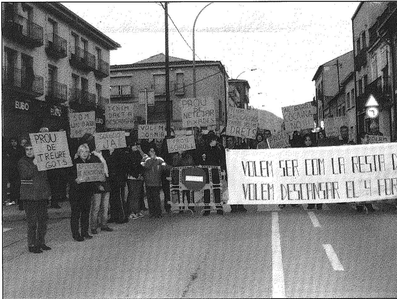
Imatge d'un dels actes de protesta organitzat fa uns mesos pels veïns per les molèsties que els genera el local (AdBM)

Segons les representants dels veïns, després de la trobada, on "no vam tenir cap resposta, ni per bo ni per dolent", Lechuga, assenyalen "ens va dir que CiU no estava d'acord de fer l'opció de reducció horària però hi havia l'opció que CUP i PSC fessin una moció per demanar-ho fins que es pugui plantejar el trasllat". En aquest sentit, els veïns van demanar formalment a ambdues formacions si això seria possible perquè, van assenyalar, "estem decebut perquè no veiem prou moviment amb