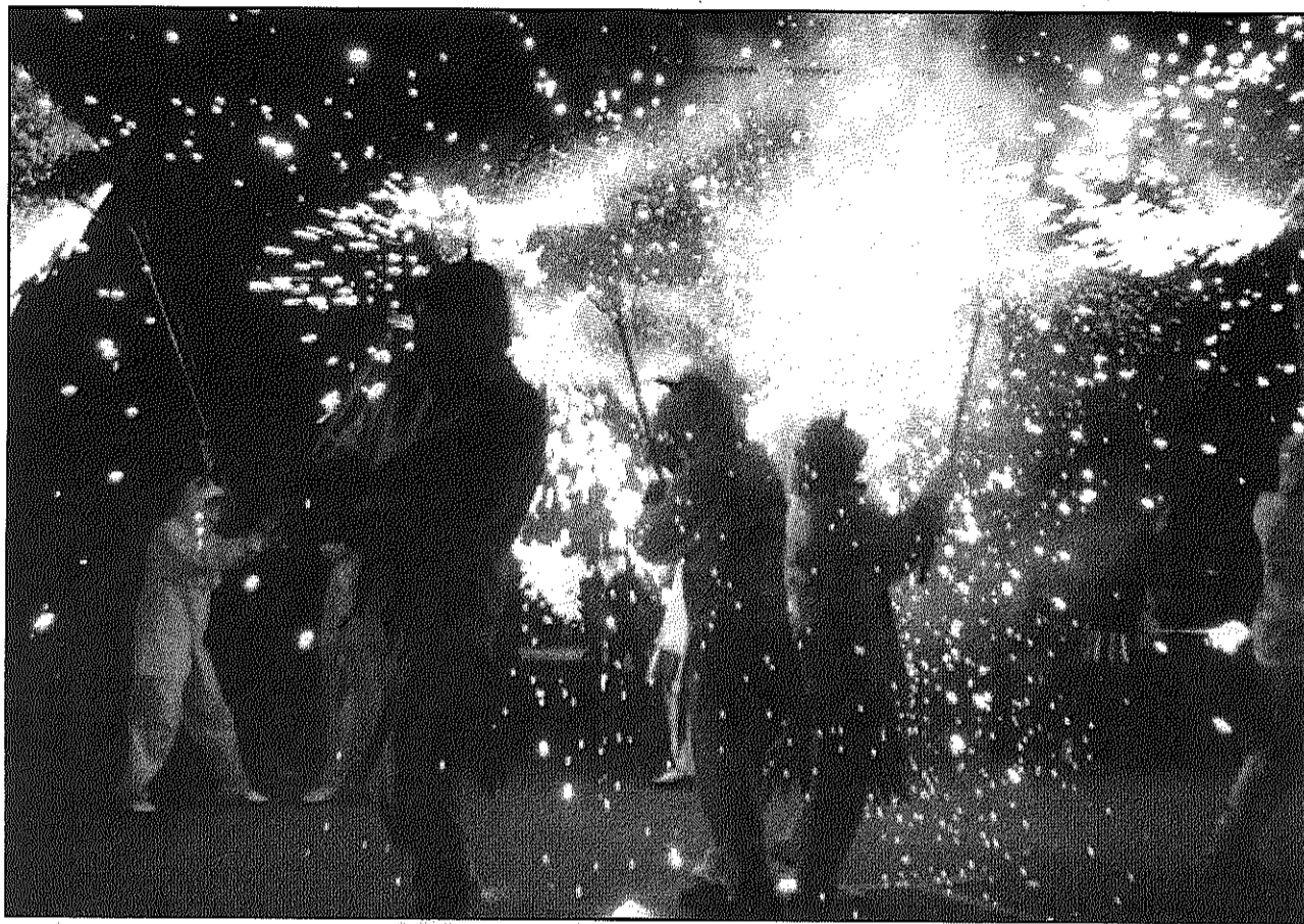
El foc serà el protagonista la tarda i matinada de dimecres per Sant Joan, la nit més curta de l'any (La Piula/Oriol Ros)

Breda. El municipi organitza per dimecres, 23 de juny, a dos quarts de 10 del vespre, un sopar a la plaça Lluís Companys, coneguda com La Miranda, en el que la Comissió de Festes i l'Ajuntament de Breda instal·larà taules, cadires i servei de barra i els assistents hauran de portar l'àpat de casa. Les reserves per assistir-hi es poden formalitzar, fins el 20 de juny, a l'Ajuntament o als establiments Can Serafi, Can Reixach i Supermercat Schlecker. Després del sopar tancarà la revetlla amb la música de Discomòbil Mega-mix. Cardedeu. Vil·la Paquita serà l'escenari dels actes de Sant Joan que organitzen les Associacions de veïns l'Estalvi i Can Serra en col·laboració amb l'Ajuntament. Aquests començaran a les 9 del vespre amb un sopar que, al preu de 15 euros, donarà dret a l'àpat, cava i coca. A les 10 s'encendrà la foguera i la nit tancarà amb el ball, a càrrec de l'Orquestra Tela Mariner. Els tiquets es poden reservar a Vil·la Paquita i les seus de les associacions de veïns.