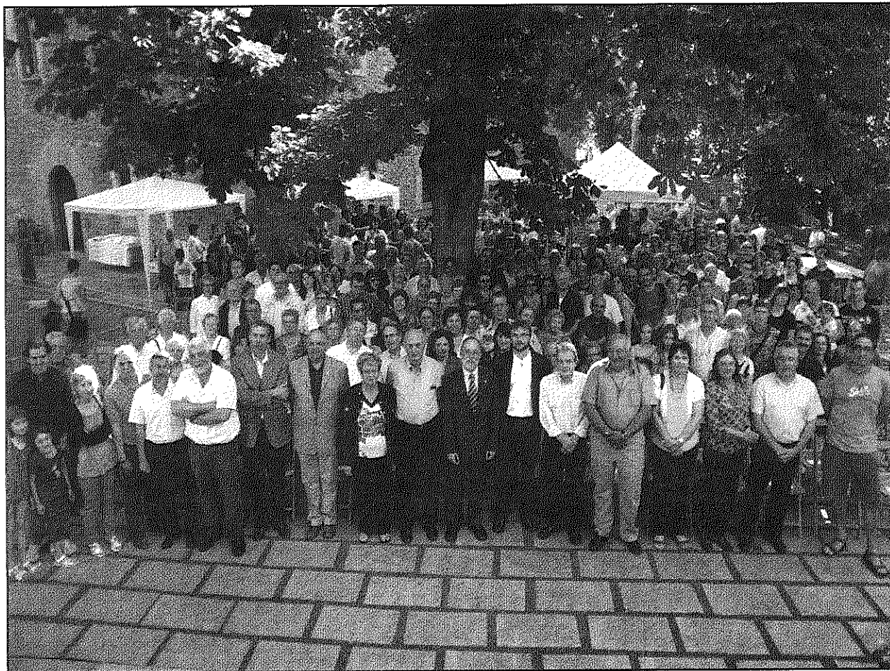
Una imatge dels més de 300 assistents a l'acte de celebració del 10è aniversari de la Fundació dissabte