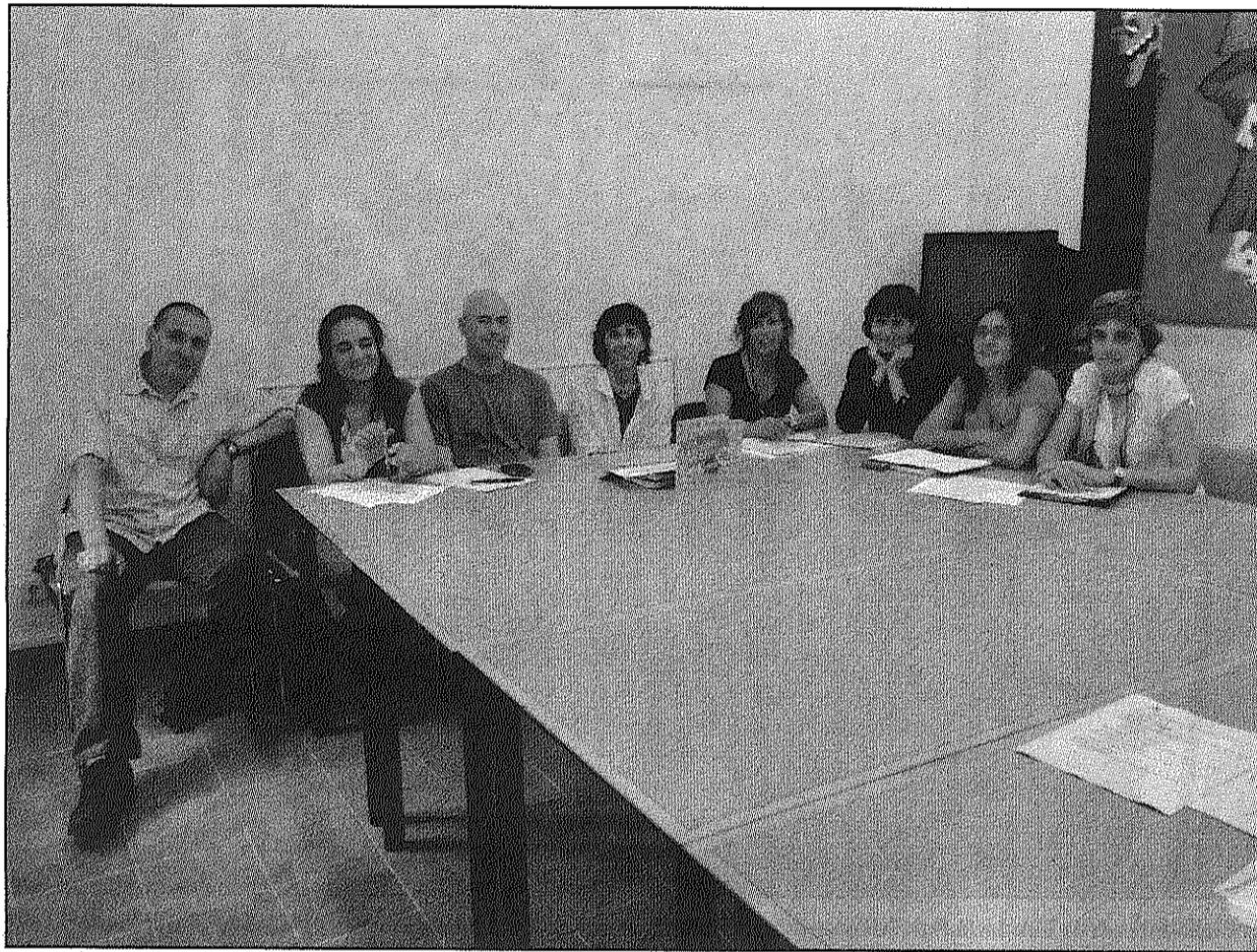
Una imatge de la reunió mantinguda dimecres entre l'Ajuntament i els organitzadors de les activitats (AdBM)

El dimecres, 9 de juny, els representants de les entitats organitzadores i tècnics municipals es van reunir per concretar diferents aspectes del projecte d'activitats d'es-