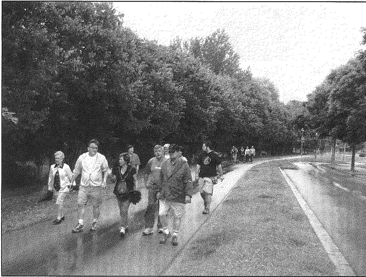
Una imatge dels participants a la caminada inaugural el passat cap de setmana de les rutes saludables

Per l'alcalde "aquestes rutes saludables com l'espai lúdic i de lleure per a gent gran inaugurat