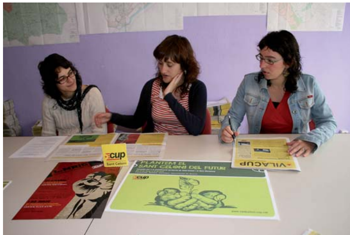
Fins el 6 de juny la CUP desenvolupa les jornades sota el títol genèric de Plantem el Sant Celoni del futur

El primer escenari de trobada va ser L'escola de música amb la projecció del documental El Somni, sobre la transhumància i els últims