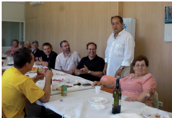
Felip Puig amb els veïns de Vallgorguina

VALLGORGUINA.- El passat diumenge 12 de juliol el secretari general adjunt de Convergència Democràtica de Catalunya, Felip Puig, va visitar la urbanització de Vallgorguina La Baronia del Montseny, on va compartir una jornada matinal amb els veïns de tots els nuclis urbans que ho van desitjar. Puig va aprofitar l'ocasió per definir el pont d'accés a la urbanització La Baronia del Montseny i també el túnel d'entrada a Canadà Park com "accessos indignes". Per aquest mo-