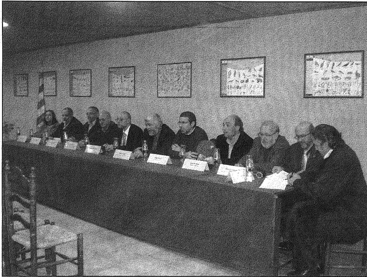
Els alcaldes del Baix Montseny durant la primera jornada celebrada a Can Putxet, a Sant Celoni