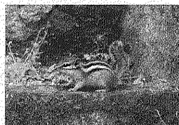
Un exemplar de l'esquirol.

cosa si es troba al bosc és perquè alguna persona l'ha deixada anar. La seva presència no és una bona notícia perquè, com amb la majoria d'espècies forasteres, podria convertir-se en un problema de convivència i reemplaçament de les espècies pròpies, provocar canvis en el funcionament dels ecosistemes naturals o aportar malalties i dificultats de supervivència a d'altres espècies. També és possible que els esquirols no